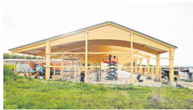
Der neue DHL-Zustellstützpunkt wurde in Holzbauweise errichtet. Auch Gewerbebauten sind kostengünstig und schnell in Holz zu realisieren.

Speziell auf dem ehemaligen „Meindl-Gelände“ soll der Schwerpunkt serieller und bezahlbarer Wohnraum im Speckgürtel von München umgesetzt werden. Ein städtebaulicher Wettbewerb