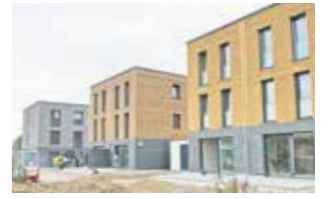
6 Doppelhaushälften Geiselhöring