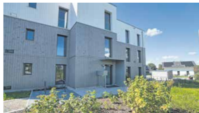
Mit KfW-Förderung und einem Zuschuss des Landes Bayern gut realisierbar: Sozialer Wohnungsbau kostengünstig und ökologisch.

Mit transparenten finanziellen Kostenlösungen kann man als Generalunternehmer den Herausforderungen am Bau Paroli bieten.