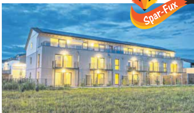
Holz-Hybrid-Bauweise in der Zinniengasse, Dorfen: Die KfW 40 Plus-Bauweise macht extreme Energieeinsparung möglich.

Eigentümer und Mieter profitieren vom höchsten Baustandard