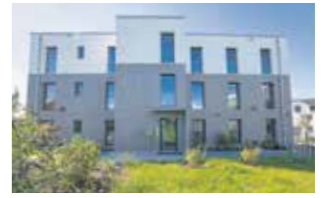
9 Sozialwohnungen Eiselting