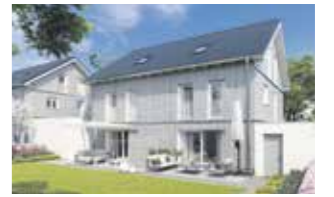
10 Doppelhaushälften Bergham