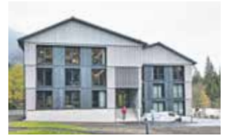
36 Mitarbeiterwohnungen BMW, Ammerwald

Trotz schwierigem Umfeld im Jahr 2022 stellte die Robert Decker Firmengruppe über 400 Wohnungen und Häuser fertig: