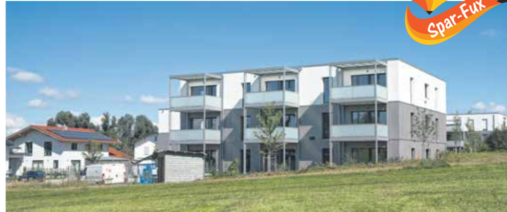
Mehrfamilienhaus mit insgesamt neun in Holzmassiv-Bauweise geschaffenen Wohnungen in der Gemeinde Eiselting.

Zudem wurden die Zwei-, Drei- und Vier-Zimmer-Wohnungen an das Nahwärmenetz der Firma HeimatEnergie+ angeschlossen. Durch die sehr gute Isolierung geht auch weniger Energie verloren, was im Angesicht der