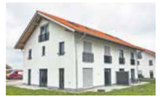
7 Doppelhaushälften Sauerlach