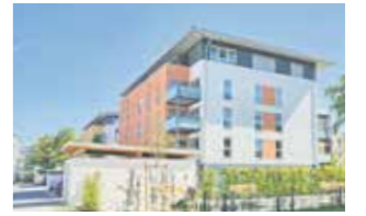
160 Wohnungen Waldkraiburg