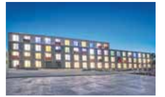
174 Wohnungen in Modulbauweise, Straubing