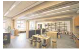
Montessori Kinderhaus Dorfen